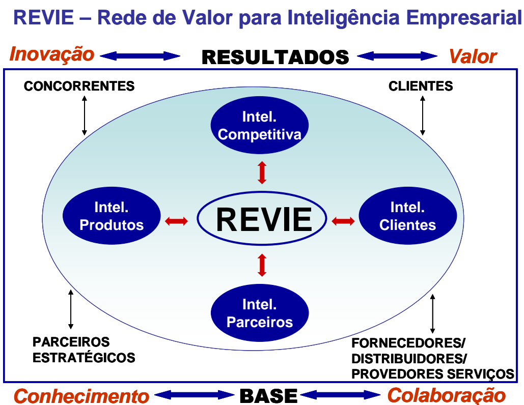
Figura 1 – REVIE (Rede de Valor para Inteligência Empresarial)

A Rede de Valor para Inteligência Empresarial (REVIE) é uma rede formada pela empresa, clientes e parceiros estratégicos (fornecedores, distribuidores, provedores de serviços) com o objetivo não só de reunir a informação e integrar os dados, mas de criar e partilhar o conhecimento com um nível de colaboração em que os ganhos e resultados sejam maximizados.